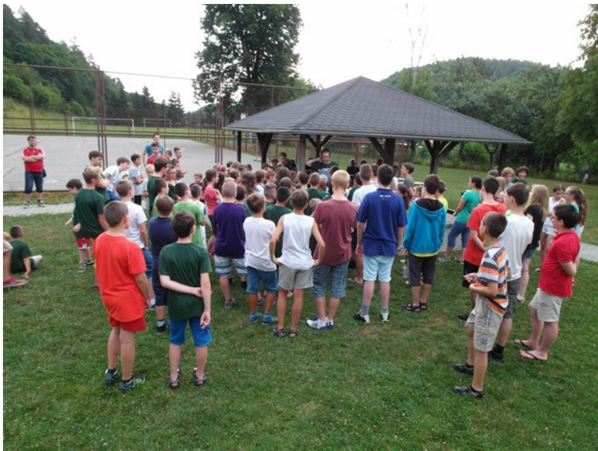
Obr. č.2: Úvodný príhovor a žrebovanie do družstiev