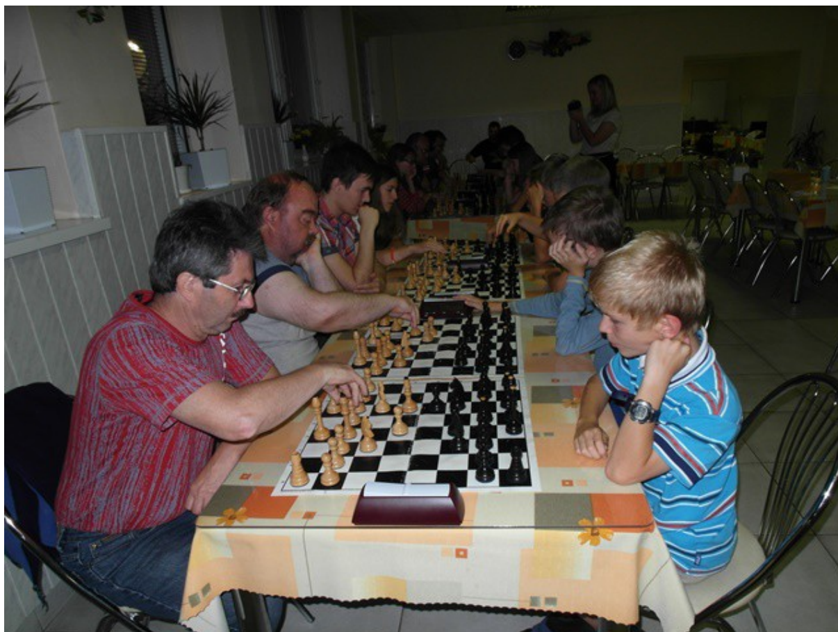
Obr. č.14: Bleskový turnaj extra predĺžil deviatke účastníkov večierku

V hlavnom turnaji, ktorý sa hral tempom 1 hodina na partiu s 30-sekundovou bonifikáciou za každý vykonaný ťah, sme ponechali systém bodovania 3 body za výhru, 1 bod za remízu a samozrejme 0 bodov za prehru. Rezultatívnosť partií stúpla na 79,2% (na prvých desiatich šachovniciach bola dokonca 86,7%) a trojbodový experiment na budúci rok isto ostane. Ale aj napriek tomu, že každá remíza tak bola viac či menej stratou a zväčša sa hralo, našlo sa aj viacero „remíz bez boja“. Takže ak chcete víťaziť trénujte, aby ste nemuseli pľichtiť!