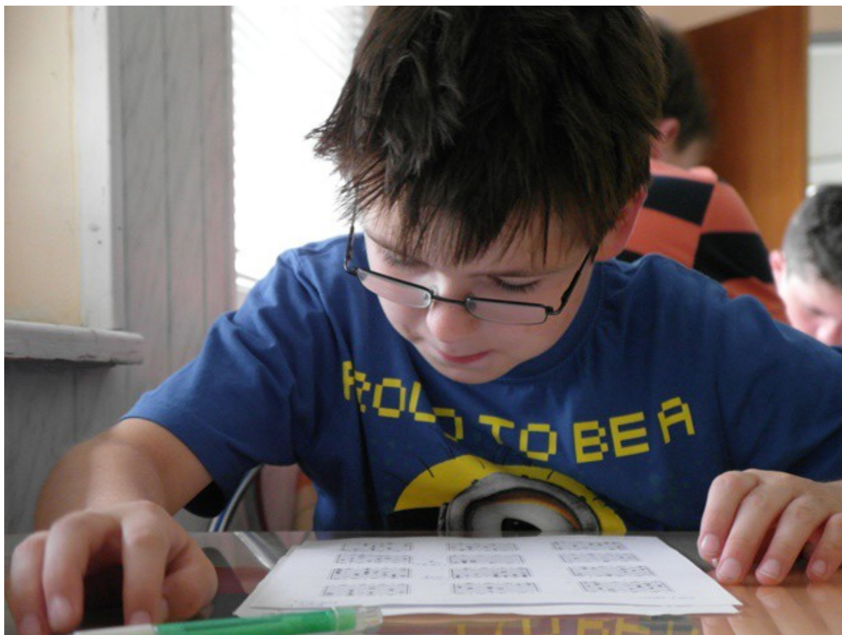
Obr. č.21: Dobrovoľné diagramy tento rok zaznamenali veľký boom!