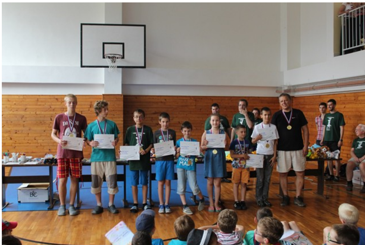
Obr. č.34: Víťazné družstvo súťaže družstiev - Poľské vajcia