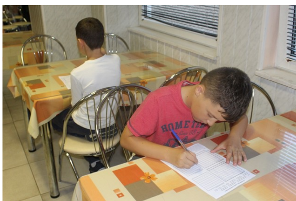
Obr. č.25: Hádaj kto / čo som!