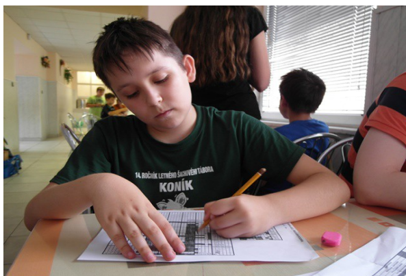
Obr. č.33: Maľované krížovky

Aj táto disciplína zamiešala poradím súťaže družstiev a napokon to dopadlo nasledovne: