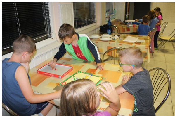
Obr. č.22: 6 berie!