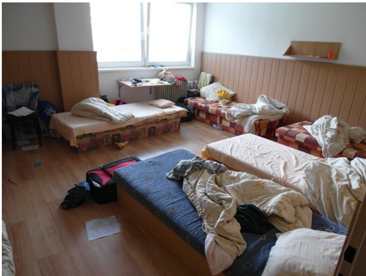
Obr. č.3: Neohlásená kontrola poriadne zamiešala výsledkami bodovania izieb