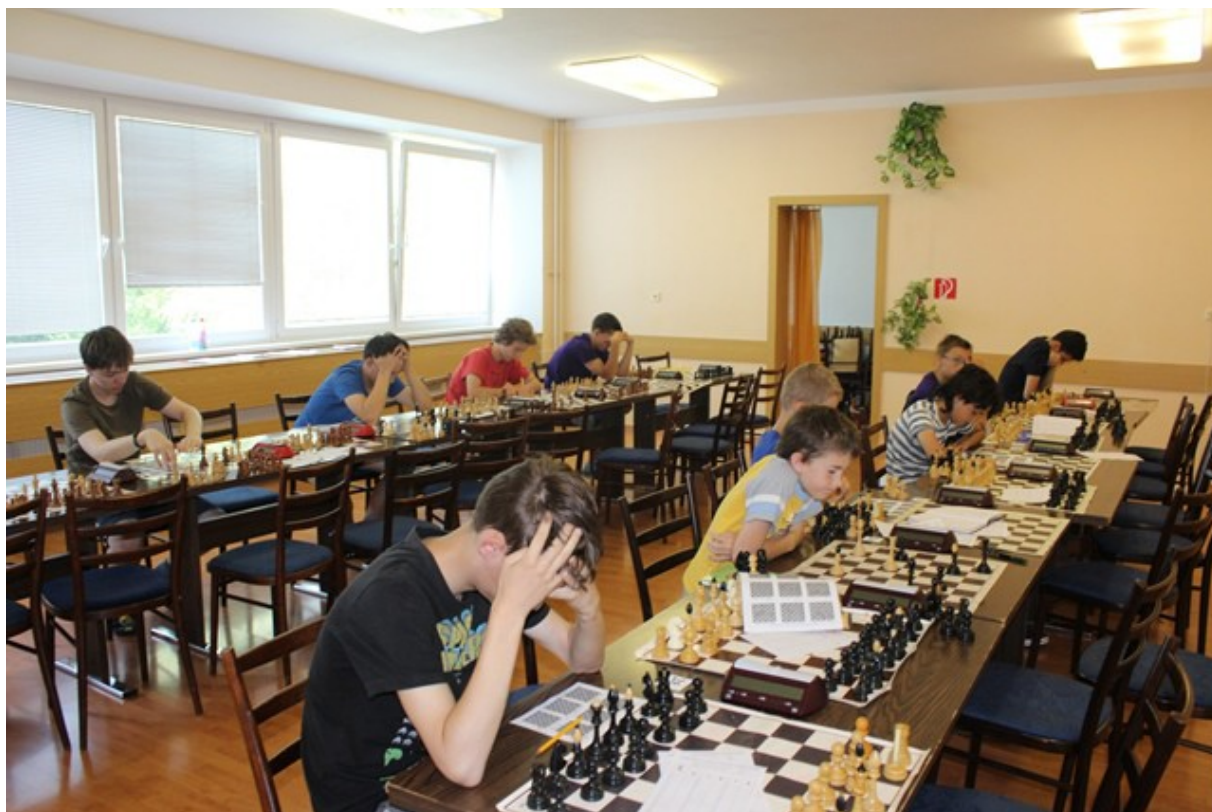
Obr. č.20: Jedna z tréningových skupín počas riešiteľskej súťaže