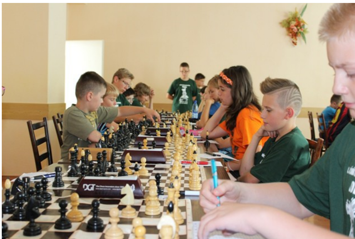
Obr. č.15: Pohľad do jednej z troch hracích miestností turnaja