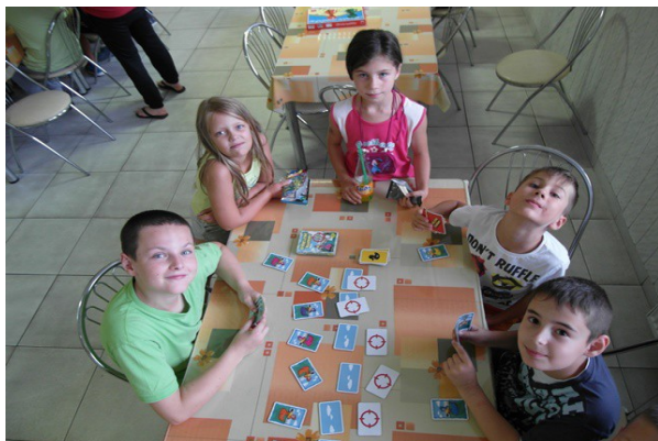
Obr. č.30: Strelené kačice