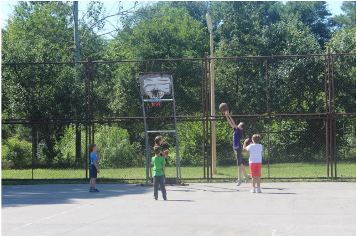
Obr č.11: Jeden z voľných basketbalových zápasov

Zo športových aktivít, ktoré sa nepočítali do súťaže družstiev, bol najčastejšie využívaný basketbal, bedminton a frisbee.