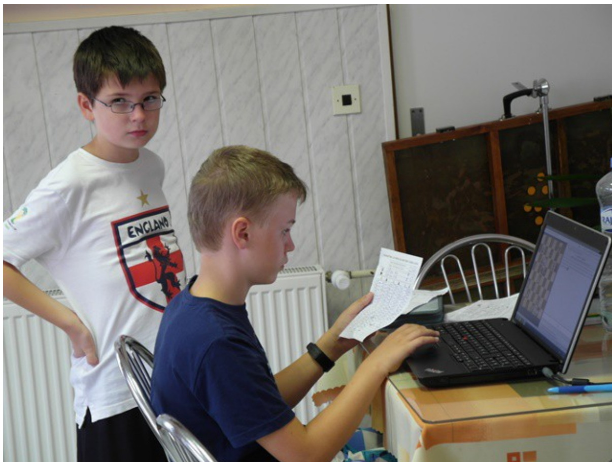
Obr. č.19: Nahadzovanie partií bolo každodennou rutinou