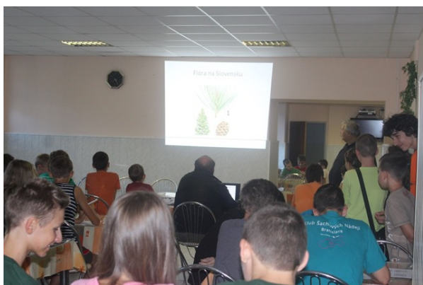
Obr. č.32: Vedomostný kvíz o Slovensku