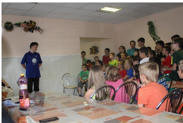
Obr. č.23: Americký žolík