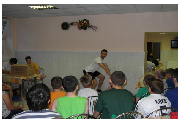
Obr. č.24: Človeče nehnevaj sa!