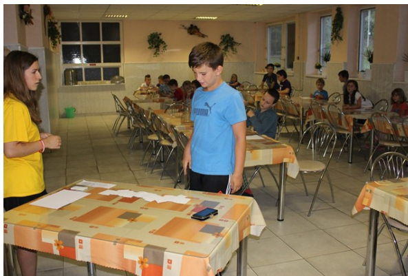
Obr. č.31: Vedomostný test pre 1. a 2.ročník